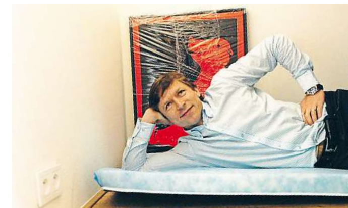
Pokoj pro hosta Případná návštěva musí ke svému lůžku dojít po čtyřech. „Pokoj je opravdu jen na přespání,“ směje se architekt.

Obyvatelný showroom je světovým unikátem, nikde jinde zatím podobný projekt najít nelze. Jeho autor by byl nicméně rád, kdyby se rozrostl a vytvořil celorepublikovou síť. Ve městech po celém Česku by tak postupně vznikaly menší či větší byty určené pro přespání a vyzkoušení výrobků. Na webových stránkách projektu by pak případní návštěvníci měli k dispozici přehled akcí, které ve městě mohou navštívit. Lenka Šklubalová